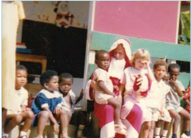
École maternelle de Libreville, Gabon.

Sa petite enfance se déroule à l'école maternelle de Libreville au Gabon. Elle grandit près de l'eau, fait la découverte d'une autre culture et d'une lumière forte et éclatante.