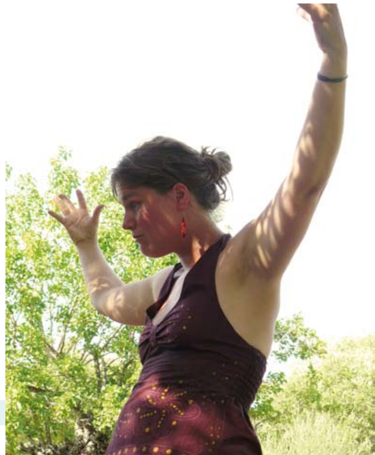
Parc de Saleccia, Corse.

Quatre femmes, quatre rides, quatre sillons, beaucoup de sourires.